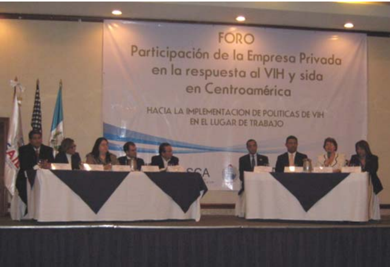
I Foro Regional "Participación de la Empresa Privada en la respuesta al VIH y sida en Centroamérica. Hacia la implementación de políticas de VIH en el lugar de trabajo." Guatemala, 27 y 28 de octubre, 2009.