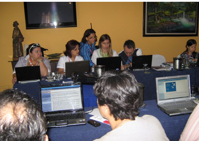
Capacitación sobre el uso y aplicaciones del Workplace Policy Builder. San José, Costa Rica, marzo 2010.

Una política de VIH en el lugar de trabajo es un medio costo-efectivo para que las empresas logren un impacto positivo en un problema de alcance mundial. Estas políticas han demostrado ser formas de respuesta efectivas a la epidemia, así como oportunidades para que las empresas contribuyan al bienestar de sus colaboradores y a su propio éxito.